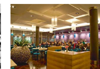
„Living Room“ heute

Adresse: Luisenstraße 9-13, 44787 Bochum (Parken im Parkhaus P2 Dr.-Ruer-Platz, Luisenstraße, 44787 Bochum)